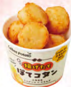
Calbee Potato ぽてコタン 北海道産 じゃがいも×たまねぎ 揚げ たて! 揚げたて ぽてコタン 460円(税込506円)