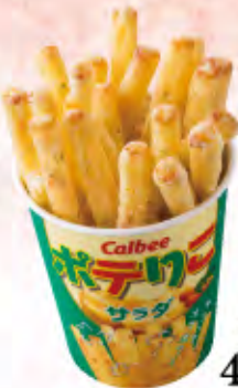
Calbee ポテリコ サラダ 揚げ たて! ポテリコサラダ 460円(税込506円)